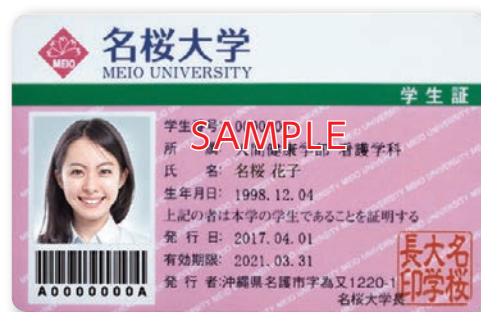
名桜大学の学生証 自然豊かな沖縄県北部地域「山原(ヤンバル)」を彩る 桜の色を基調としています。

名桜大学さまでは毎年、新入生のICカード学生証はトッパンフォームズに委託発行し、後期試験合格者などの追加発行を学生課に置いたカードプリンターで発行しています。