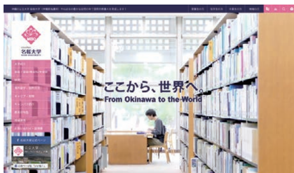
名桜大学のWebサイト

公立大学化を期に、学生課が主体となって学生証のICカード化の検討を開始し、東京でのICカードソリューション関連のイベント視察や、県内外の他大学でのICカード利用状況の調査などの情報収集を重ねた上で、トッパンフォームズと共に具体的なプラン作成に移行、翌2011年よりICカード学生証の運用を開始しました。