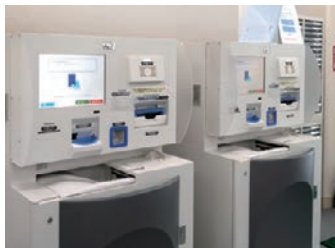
学生課に設置された証明書申請発行機 書籍の購入などにも活用されています

「従来はカード発行用のPCが決まっていた、そこにデータを保存していましたが、セキュリティの面でも気を使いましたし、破損や紛失にも注意が必要でした。現在では3名の職員が自身のPCで『ID職人Cloud』を使用しています。データはクラウド上に保管されていて皆が常に最新のデータにアクセスできるので安心ですし、特定の担当者がいなくてもカード発行ができるような体制になっています。アプリケーションの